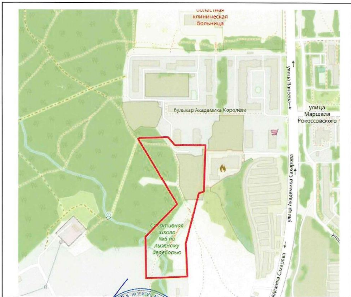
Схема границ подготовки инженерных изысканий